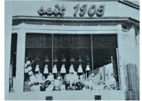
Waitzstraße 2, nach 1984

( hoffentlich ) rückwärts rausmanövriert hat, so dass er ihren Parkplatz okkupieren kann, um von dort Weihnachtseinkäufe zu erledigen ( oder auch nur Brötchen zu holen ). Nachdem sich die Verkehrslage und die genervten Autofahrer wieder beruhigt haben, die Hupen verstummt sind und die Glockentöne wieder schwach hörbar werden, erkenne ich auch die Melodie: „Kling Glöckchen, klingelingeling“. Ich blicke empor zu den 16 verschiedenen großen Glocken, die von dort oben oft kaum zu hören sind und von sehr vielen nicht beachtet, geschweige denn gewürdigt werden. Dabei hätten sie es wahrlich verdient, denn es handelt sich um ein sehr kostbares Glockenspiel aus Meißener Porzellan, das 1955 von der Firma Rode & Zerrath anlässlich der Geschäftseröffnung an der Ferdinandstraße bei der Meißener Porzellanmanufaktur in Auftrag gegeben wurde. Nur die Manufaktur in Meißen traute sich bisher an die komplizierte Herstellung eines Glockenspiels (anderen waren wohl die Gewinnerwartungen zu gering oder sie scheiterten wie die Firma Rosenthal 1956). Es gibt in Deutschland inzwischen einige Glockenspiele aus Porzellan (die meisten in Sachsen, aber kein weiteres in Hamburg!), z. B. im Rathausurm von Lüneburg (das ist das derzeit größte mit 42 Glocken), in Bremen (Böttcherstraße), Dresden, Weimar und eben in Meißen. Dieses war das erste (mit 37 Glocken), das sich stimmen ließ, also richtig funktionierte, wurde 1929 zur 1000 Jahr-Feier der Stadt Meißen ge-