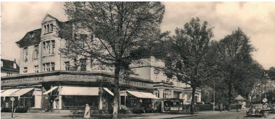
Geschäftshaus Waitzstraße 2 mit Burmeister