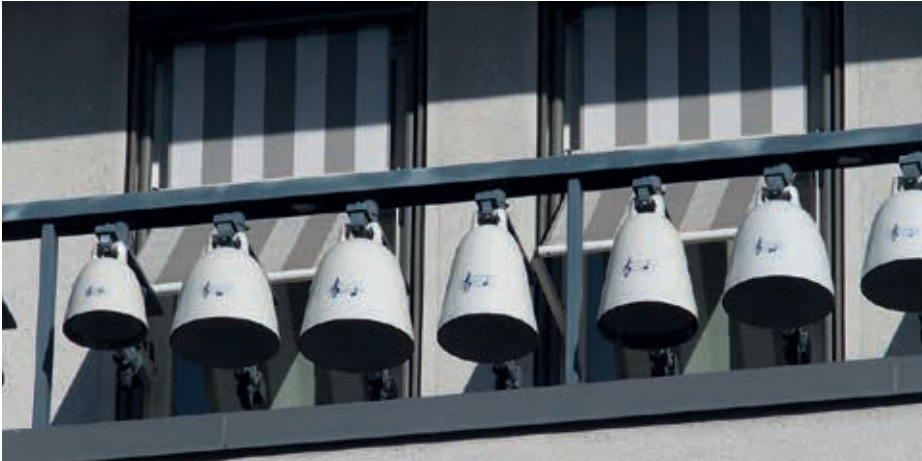
Waitzstraße 4, 2014, Glockenspiel aus Meißener Porzellan (hing früher bei Burmeister)